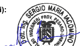
TAVOLA N° 1.03

DESCRIZIONE TAVOLA PLANIMETRIA PIANO TERZO CIRCUITI IDENTIFICATI (dorsali orizzontali e montanti verticali): - Circuito di riscaldamento 1 e 2 - Circuito Acqua Calda Sanitaria - Circuito Rete Idrica